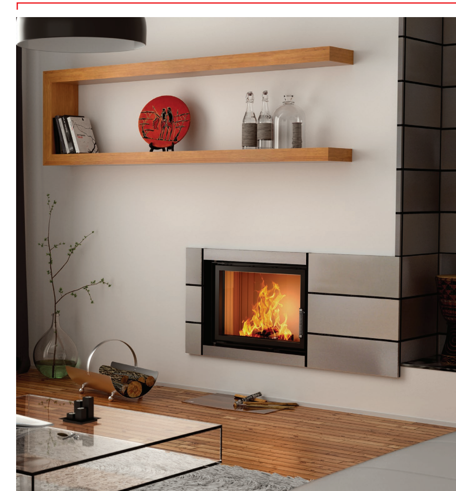
Wkład kominkowy ALBERO AL 9 S.H