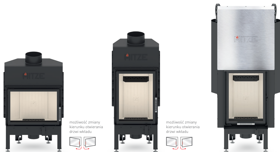
ALBERO AL9 S.H

Dodatkową zaletą maskownic wkładów kominkowych jest prosty sposób montażu, który można przeprowadzić samodzielnie.