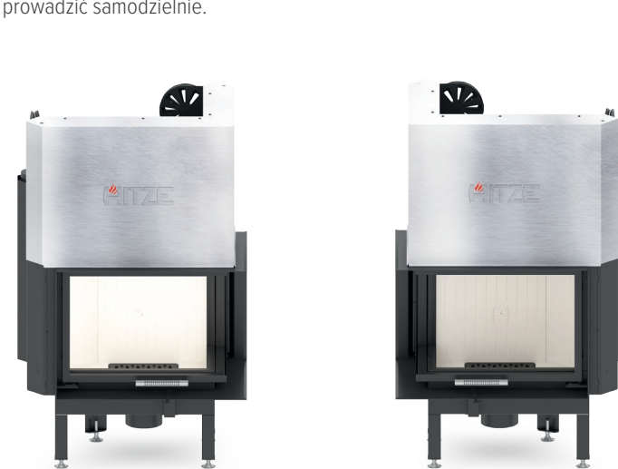
ALBERO AL9 RG.H