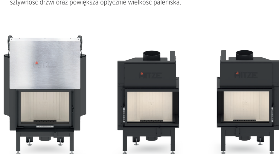
ALBERO AL9 G.H